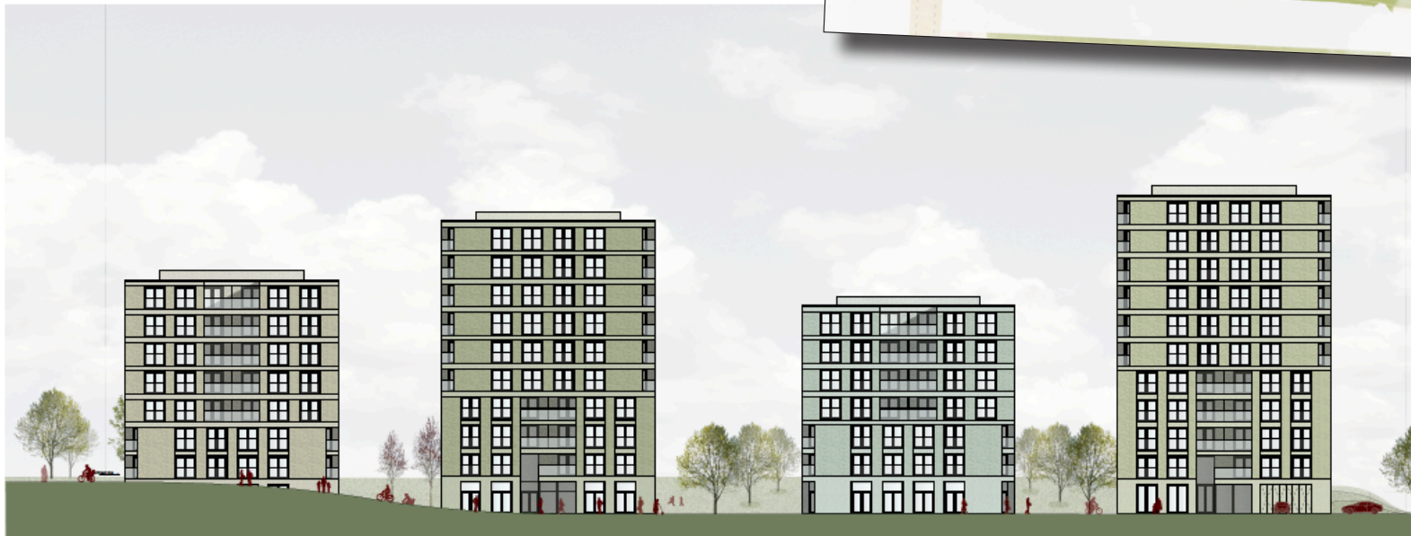
gevelaanzicht vanaf het water